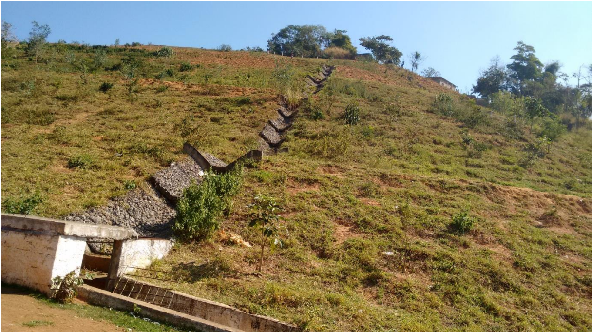
Figura 6 ó Obra de recuperação do Morro do Bumba