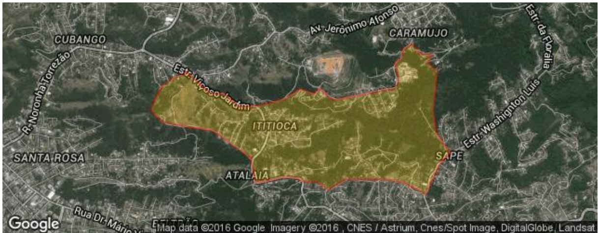
Figura 3 ó Localização dos Bairros Cubango e Viçoso Jardim