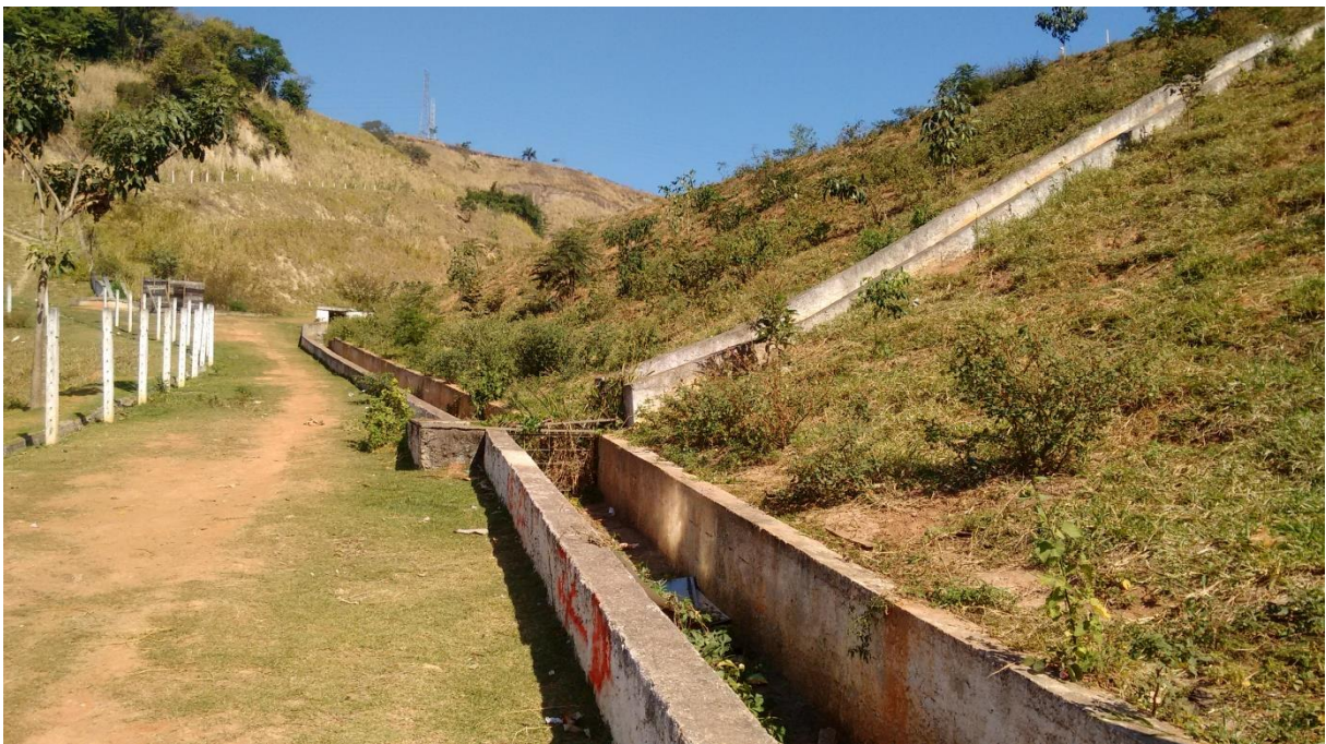
Figura 5 ó Obra de recuperação do Morro do Bumba

O morro após o desastre passou por um Projeto de Recuperação Ambiental com obras de retaludamento, diques de contenção, colocações (de Inclinômetro e do Piezômetro), plantio de seis mil mudas de espécies nativas, feito através de compensação ambiental por construtores que requerem o corte de árvores em terrenos onde plantaram novos prédios, começou com duas mil plantas em 2012 e deverá se prolongar até 2016, segundo a Secretaria de Meio Ambiente.