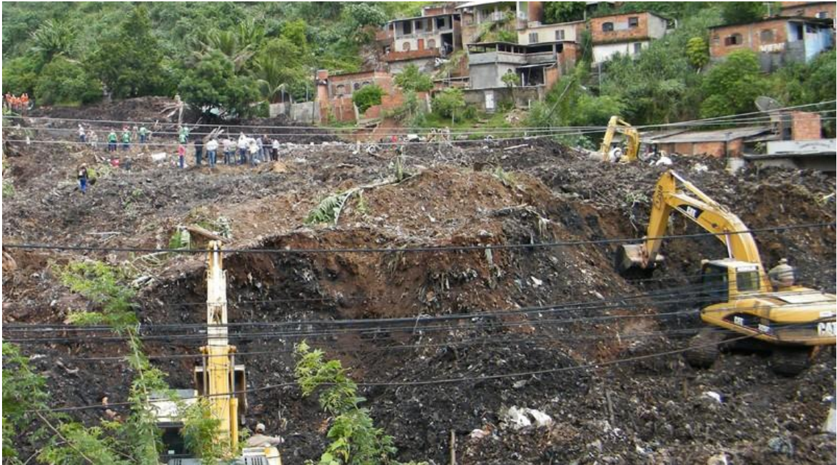
Figura 3 ó Desastre no Morro do Bumba